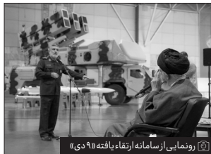
رونمایی از سامانه ارتقاء یافته «۹ دی»