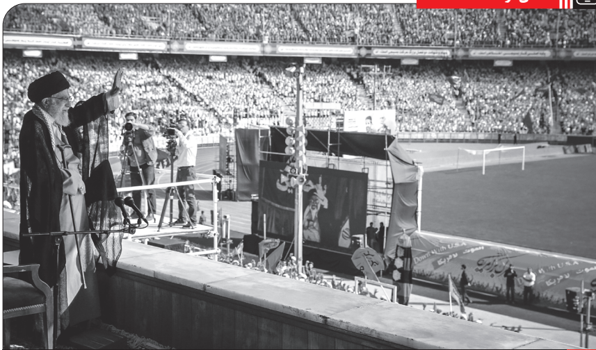
حضور و سخنرانی رهبر انقلاب اسلامی در همایش ده‌هزار نفری «خدمت بسیجیان» در ورزشگاه آزادی، ۱۳۹۷/۷/۱۲