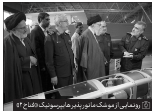
رونمایی از موشک مانور بندر هایپرسونیک (فتاح ۲)