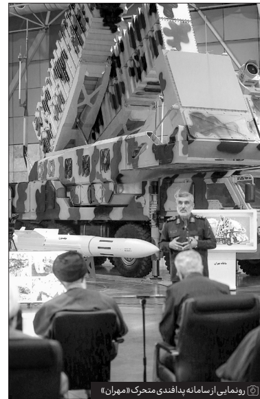
رونمایی از سامانه پدافندی متحرک «مهران»