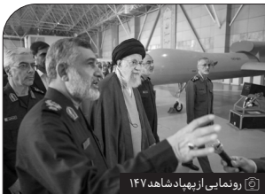
رونمایی از پهباد شاهد ۱۴۷