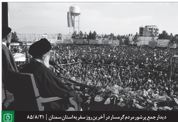
دیدار جمع پرشور مردم گرمسار در آخرین روز سفر به استان سمنان | ۸۵/۸/۲۱

آزادی یکی از بزرگترین نعمت‌های الهی است که یکی از شعبش آزاداندیشی است. بدون آزاداندیشی، این رشد اجتماعی، علمی، فکری و فلسفی امکان ندارد. در حوزه‌های علمی، دانشگاه و محیط‌های فرهنگی و مطبوعاتی، هو کردن کسی که حرف تازه‌ای می‌آورد، یکی از بزرگترین خطاهاست؛ بگذارید آزادانه فکر کنند. البته من فهم غلط از آزادی را تأیید نمی‌کنم؛ من باز گذاشتن دست دشمن را در داخل برای اینکه مرتباً گاز سمی تولید کند و در فضای فرهنگی یا سیاسی کشور بدمد، تأیید نمی‌کنم؛ من براندازی خاموش را - آن چنانی که خود آمریکایی‌ها گفتند و عواملشان چند سال قبل در اینجا سادگی و بی‌عقلی کردند و به زبان آوردند - بر نمی‌تابم و رد می‌کنم؛ اما توسعه‌ی آزادی و رها بودن میدان برای پرورش فکر و اندیشه و علم و فهم، ربطی به اینها ندارد. ظرفیتی لازم است که آدم این دو منطقه را از همدیگر باز شناسد و مرز اینها را معین بکند. ● ۸۵/۱۱/۲۹