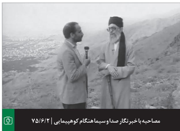
مصاحبه با خبرنگار صدا و سیما هنگام کوهپیمایی | ۷۵/۶/۲

امام (ع) - البته نه به دانش‌جویان - مکرر به سیاستمداران و نمایندگان و مسئولان و فعالان سیاسی توصیه می‌کردند و می‌گفتند مثل مباحثه‌ی طلبه‌ها رفتار کنید. طلبه‌ها در هنگام مباحثه، گاهی اوقات علیه هم عصبانی می‌شوند - حالا مضمون هم می‌گویند به طلبه‌ها، می‌گویند کتاب تو سر هم می‌زنند! که البته چنین چیزی نیست - بحث می‌کنند، داد می‌کشند؛ کسی نگاه کند، خیال می‌کند این‌ها می‌خواهند مثلاً همدیگر را تکه‌پاره کنند؛ در حالی که نه، مباحثه که تمام می‌شود، بلند می‌شوند می‌روند با همدیگر سر سفره می‌نشینند و آبگوشت‌شان را می‌خورند، با هم حرف می‌زنند، با هم دوست‌اند، رفیق‌اند. امام می‌گفتند: سیاسیون - چه در مجلس، چه در دولت، چه در حزب جمهوری اسلامی که آن وقت ما داشتیم، یا بقیه‌ی عرصه‌های سیاسی - این جوری با هم رفتار کنند. ممکن است اختلاف نظر هم باشد، بگومگو هم باشد، اما نگذارید کدورت و دشمنی به میان بیاید. ۹۲/۵/۶