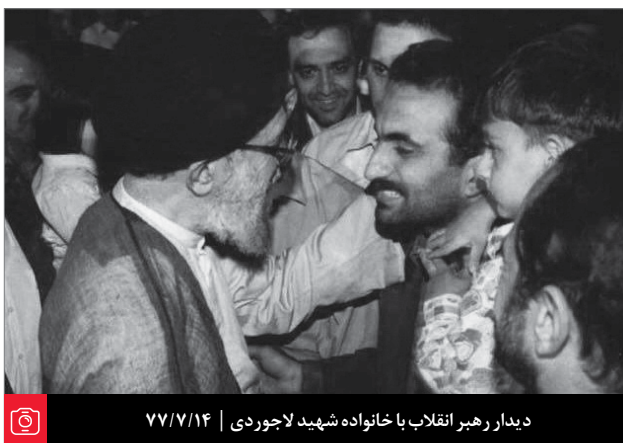
دیدار رهبر انقلاب با خانواده شهید لاجوردی | ۷۷/۷/۱۴

برادر هستند، این یک حکم اخلاقی است، یک حکم اجتماعی است، یک حکم سیاسی است. اگر مؤمنین، طوایف مختلفی‌های که در اسلام هستند و همه هم مؤمن به خدا و پیغمبر اسلام هستند، اینها با هم برادر باشند، همان طوری که