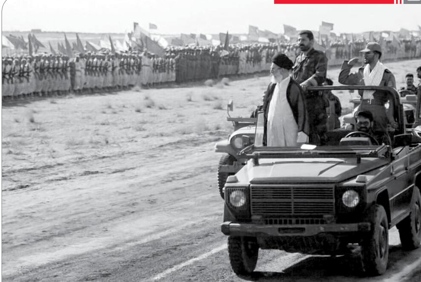
حضور رهبر انقلاب در مانور بزرگ ذوالفقار ۵۱ مهر ۱۳۷۶