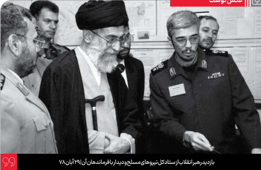
یازدهم رهبر انقلاب از ستاد کل نیروهای مسلح و دیدار با فرماندهان آن ۲۹ آبان ۷۸

وظیفه دارد. بدون احساس مسؤولیت، این ایمان کارایی خود را از دست خواهد داد. این دو عنصر باید با شجاعت، رشادت، روحیه آمدن به میدان و توجه به قدرت درونی خود همراه شود. چون یکی از چیزهایی که هر مجموعه‌ای را، هر ملتی را، هر سپاهی را دچار انهزام می‌کند، غافل ماندن از قدرت خود است. ۲۹/۸/۱۱