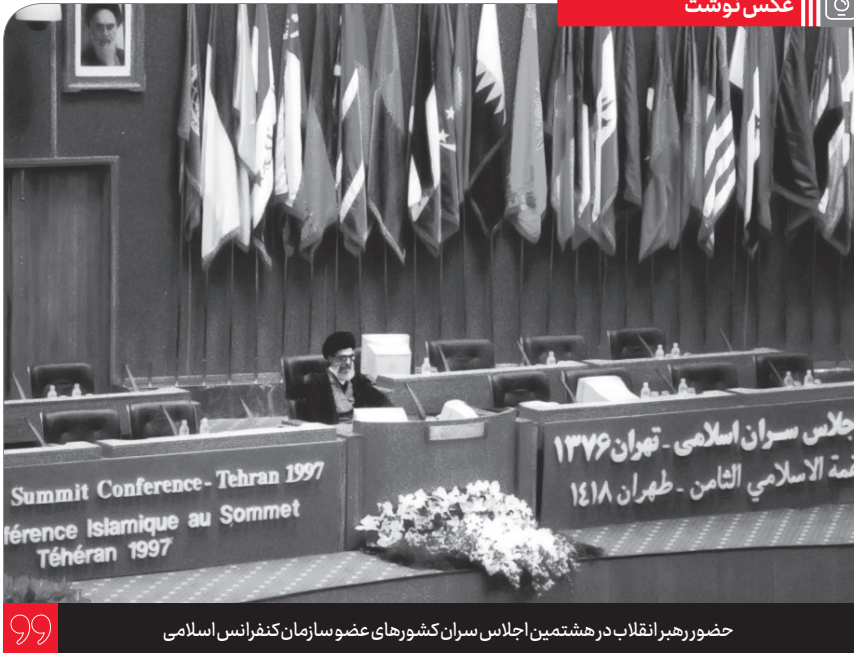
حضور رهبر انقلاب در هشتمین اجلاس سران کشورهای عضو سازمان کنفرانس اسلامی