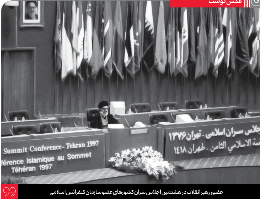
حضور رهبر انقلاب در هشتمین اجلاس سران کشورهای عضو سازمان کنفرانس اسلامی