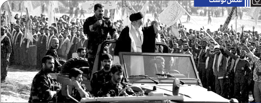
حضور رهبر انقلاب در جمع بسیجیان حاضر در اردوی فرهنگی رزمی یاران امام علی (ع)، ۱۳۷۹/۷/۲۹

روابط رژیم طاغوتی سابق با آمریکا خیلی صمیمی بود، در عین حال زیاده خواهی آمریکا آنها را هم به ستوه آورده بود؛ همین کاپیتولاسیونی را که گفتیم - مصونیت قضائی مأمورین آمریکا - تحمیل کردند بر آنها؛ آنها هم پشتوانه ای جز آمریکا نداشتند، مجبور شدند قبول کردند. معنای کاپیتولاسیون این است که اگر چنانچه یک گروه بان آمریکایی بزند توی گوش یک افسر ارشد ایرانی، کسی حق ندارد او را تحت تعقیب قرار بدهد. اگر یک مأمور خُرده پای آمریکایی در تهران به یک مرد شریف ایرانی یا به یک زن شریف ایرانی تعدی بکند، کسی حق ندارد او را تحت تعقیب قرار بدهد؛ آمریکایی ها میگویند حق ندارید، خودمان قضیه را حل میکنیم؛ دلت یک ملت از این بیشتر نمیشود. همین محمدرضا را بعد از آنکه از ایران فرار کرد و یک مدت کوتاهی به آمریکا رفت، از آنجا بیرون کردند، او را نگه نداشتند؛ یعنی این قدر هم به او وفاداری نکردند؛ این جوری هستند. ملتها و حتی دولتها به آمریکایی اعتمادند به خاطر همین رفتار و رویکردی که در سیاست آمریکایی ها هست. ● ۱۳۹۲/۸/۱۲