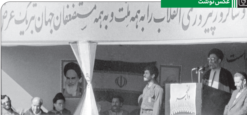
تصویری از حضور و سخنرانی آیت الله خامنه ای در مراسم سالگرد پیروزی انقلاب، ۱۳۶۳/۱۱/۲۲

آن که میتواند یک تمدن را محتمل کند و ممکن کند و تحقق ببخشد، عبارت است از نیروی انسانی... این نسل را شما میخواهید امروز بسازید. نسلی که خود ساخته است، دارای هویت است؛ هویت ایرانی - اسلامی محکم و عمیقی دارد، دلپاخته و فریفته ی این و آن و بازمانده های تمدن منسوخ شده ی شرق و غرب نیست؛ نسلی است دانا، دانشمند، کارآمد، ماهر، آشنا با سبک زندگی اسلامی و سنت های ایرانی؛ یک چنین نسلی لازم است تا بتواند آن تمدن را بسازد... اگر بخواهیم آن تمدن با آن فراگیری به وجود بیاید، ما بایستی این نسل را توسعه بدیم... این دوازده سال [دوران تحصیل در مدرسه] بزرگ ترین فرصت است برای جمهوری اسلامی که بتواند ارزشها را، آرمانهای انقلاب را بدرستی به این نسل منتقل کند و هویت اسلامی و ایرانی را در او نهادینه کند. ● ۱۴۰۱/۲/۲۱