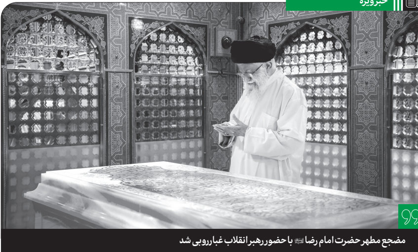
مضحیح مطهر حضرت امام رضا (س) با حضور رهبر انقلاب غبارروبی شد

همزمان با روزهای آغازین ماه ربیع‌الاول، مراسم غبارروبی ضریح مطهر حرم ثامن الحجج حضرت علی بن موسی الرضا علیه‌الآف التحیه و الثنا با حضور حضرت آیت‌الله خامنه‌ای، رهبر انقلاب اسلامی، جمعی از علما، تولیت آستان قدس و خادمان آستان مقدس رضوی برگزار شد. در این مراسم سرشار از فضای معنویت و عطر ولایت و امامت مداحان با زمزمه زیارات جامعه کبیره و امین الله به ذکر مناقب و مرثی اهل بیت (س) به مناسبت ایام شهادت امام حسن عسکری (س) پرداختند و با حضرت رضا (س) راز و نیاز کردند. به گزارش خط حزب الله، در حاشیه این مراسم، حضرت آیت‌الله خامنه‌ای با حضور بر مزار شهید حجت‌الاسلام والمسلمین رئیسی فاتحه قرائت کردند.