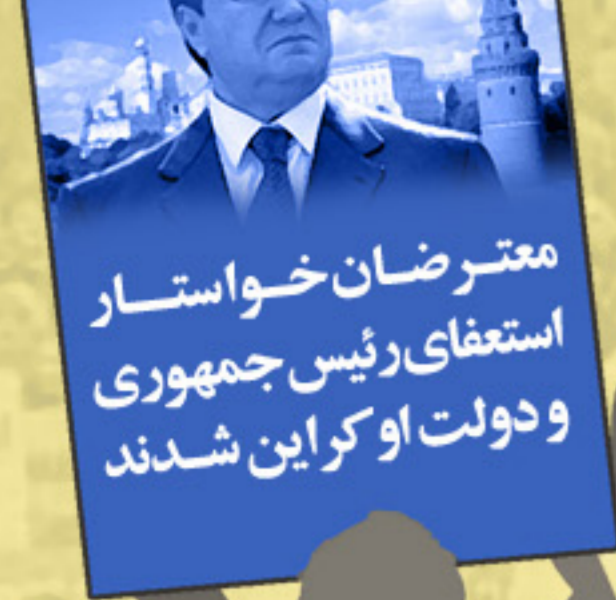
معارضین خواستار استعفای رئیس‌جمهوری و دولت اوکراین شدند

هزاران نفر از مردم اوکراین که طرفدار پیوستن کشورشان به اتحادیه اروپا بودند، در کیف، پایتخت به خیابانها آمدند، تقاضای آنها این بود که ویکتور یانوکویچ، رئیس‌جمهوری اوکراین تصمیم خود را تغییر دهد و برنامه نزدیک شدن بیشتر به اتحادیه اروپا را دنبال کند. ولی او از قبول این تقاضا خودداری کرد و در نتیجه تظاهرات ادامه یافت